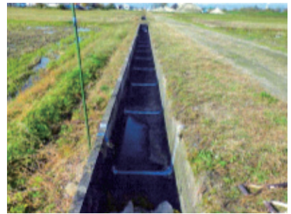
鷺林、二日町、下米塚地区 水路目地補修工事

令和7年度会津美里町単独補助事業「土地改良事業」〔補助率〕町50% 改良区50%