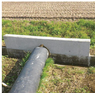
福永地区側溝嵩上げ工事