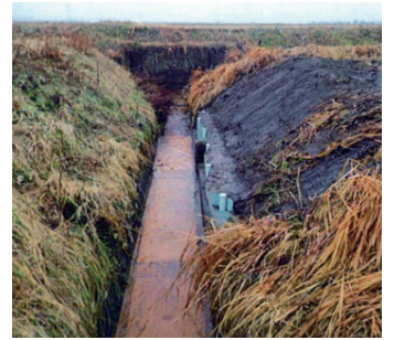
大石地区柵渠補修工事