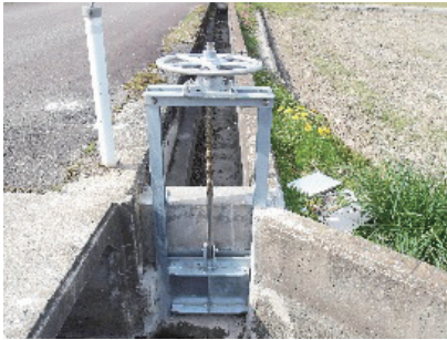
蟹川地区ゲート設置工事

令和7年度会津若松市単独補助事業「農業用排水施設維持管理事業」〔補助率〕市50% 改良区50%