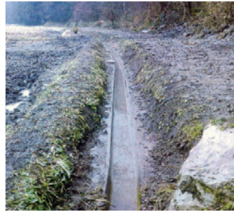
馬越地区排水路布設工事