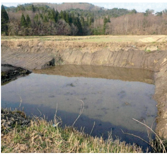
八重松ため池土砂浚渫工事

令和7年度会津美里町単独補助事業「土地改良事業」〔補助率〕町50% 改良区50%