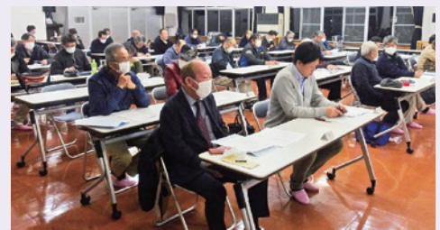
通常総代会の様子