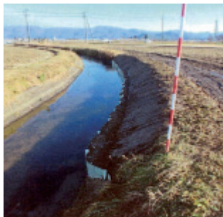
西後庵地区土留鋼板設置工事