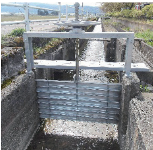
中荒井地区ゲート設置工事