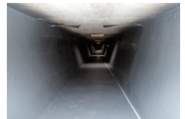
小松地区水路内面補修工事

令和7年度土地改良施設維持管理適正化「防災減災等強化事業」〔補助率〕国50% 県20% 市3%