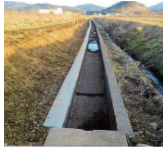
橋爪地区水路嵩上げ工事