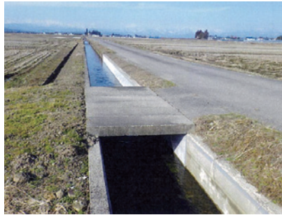
本田地区水路内面補修工事